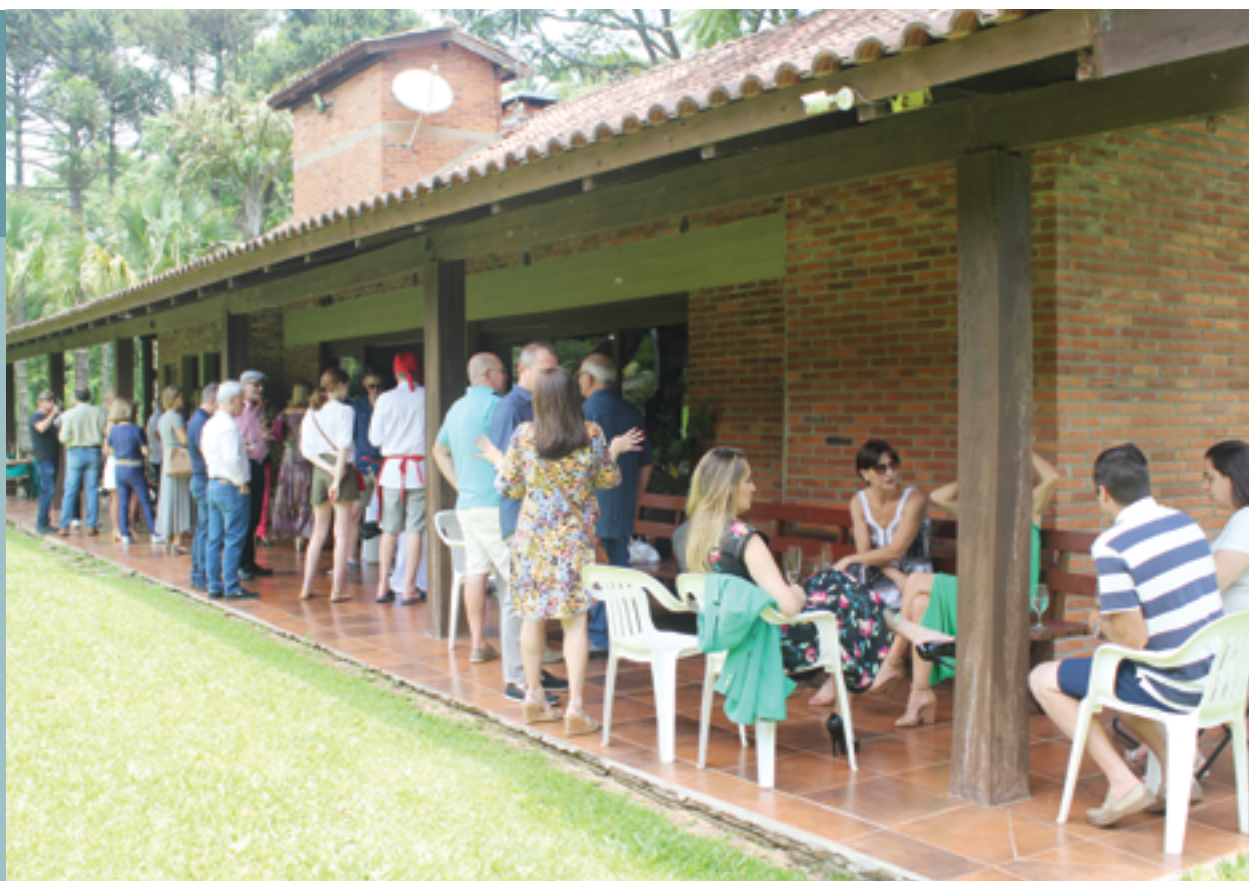
Objetivo da confraternização foi reunir todos para celebrar mais um ano de trabalho e conquistas em prol da atividade notarial brasileira