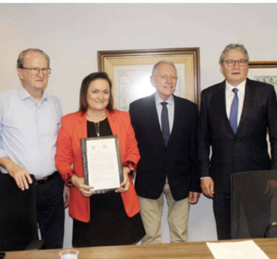
Fundação Semear completou, em 2021, 25 anos de existência e foi concebida com o apoio de um grupo de 33 empresários da região do Vale do Sinos