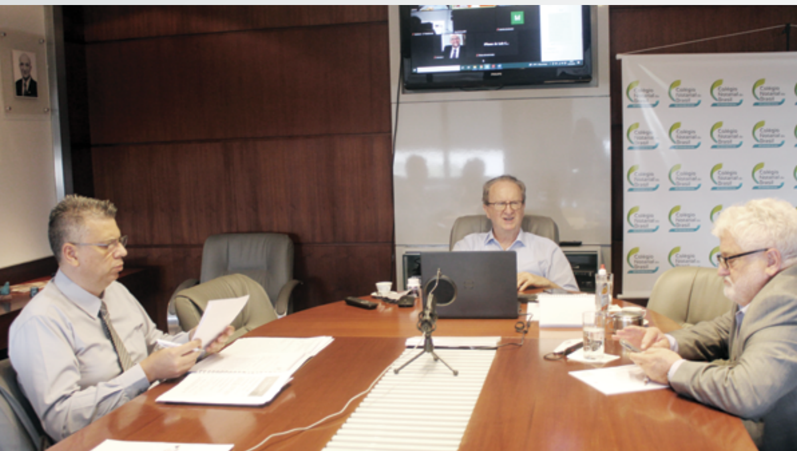
Dezenas de reuniões debateram temas importantes para o notariado gaúcho e suas atribuições durante todo o ano de 2021

Encontros tiveram como objetivo promover benefícios e melhorias para a atividade notarial gaúcha