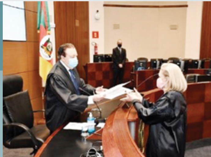
Ato ocorreu na sede do Tribunal de Justiça do Rio Grande do Sul e, em decorrência da pandemia de coronavírus, a cerimônia teve acesso restrito

Assinatura de documento com orientações sobre o Provimento 38/2021 da CGJ/RS, que tratou da "Tokenização da Propriedade Imóvel".